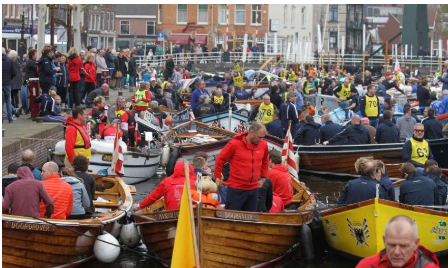
In de kom voor de start