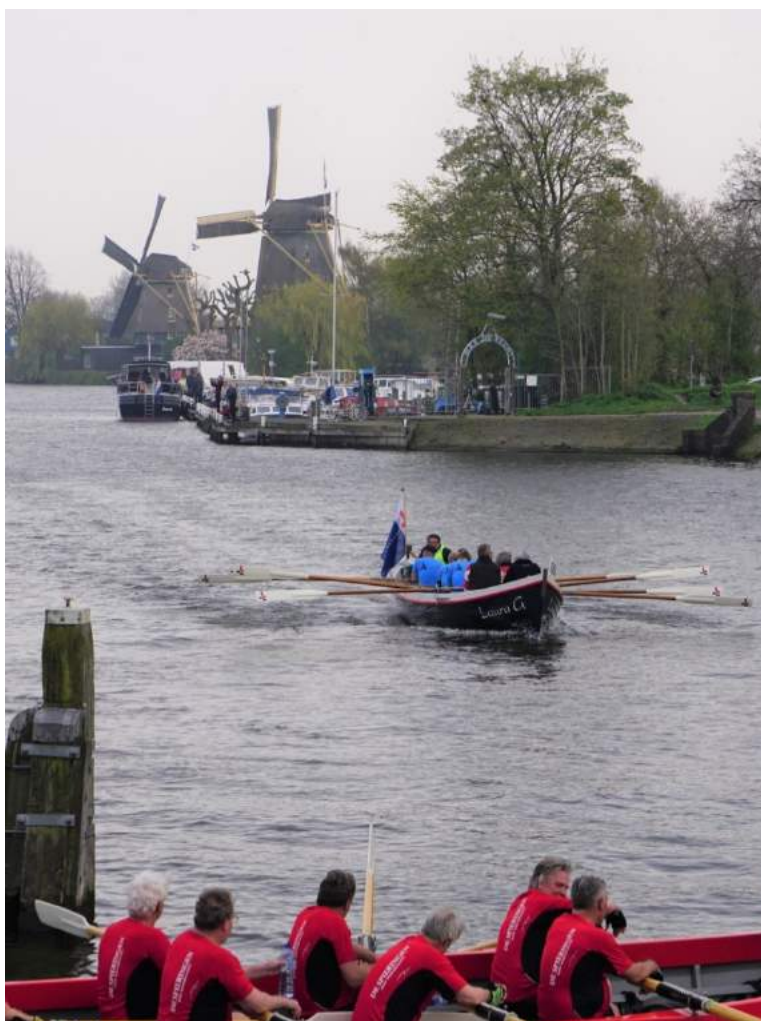
Bij de finish

Na het keerpunt laten we ons voor de spoorbrug klemzetten door een achterblijver en glipt de Lootsman ons voorbij. Het gevecht met de Lootsman heeft flink wat krachten gevergd en kreten als 'We kakken in' en het daadkrachtig tellen van de slagen, hebben slechts voor korte tijd effect. In omgekeerde volgorde passeren we de woonarken, molens, vestingwerk en daar is eindelijk het finishschip de Hydrograaf. Manon van Steven staat op de Weesper Magere Brug en weet ons op een mooie plaat vast te leggen.