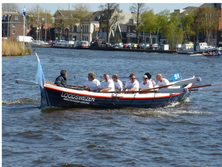
en weer richting koekfabriek