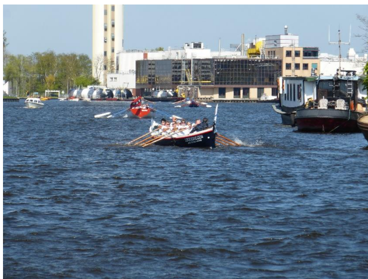
op naar keerpunt Clausbrug

Volgende strijd de HT. MELD U AAN! Voor u het weet zijn de plaatsen bezet door ??