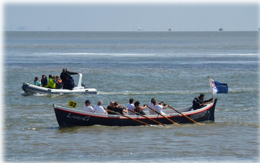
In het Schuitengat