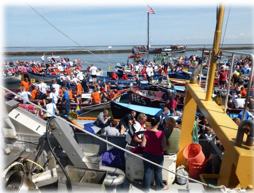
Met z'n allen in de kom