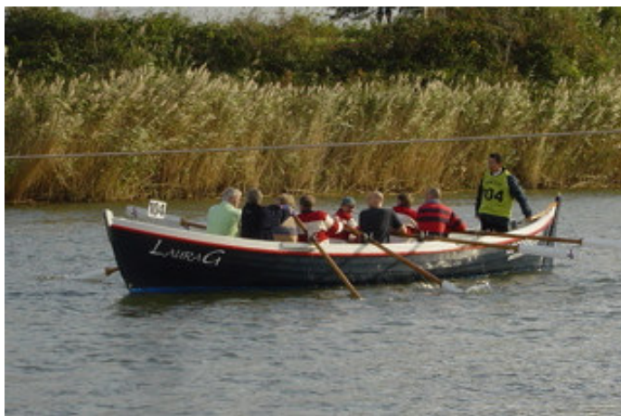
De eerste ploeg op zaterdag.