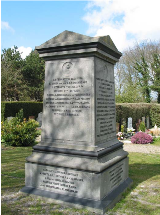
Het monument van de Adder in Huisduinen

Niemand besteedde er verder aandacht aan en zodoende wisten de autoriteiten niets. De commandant van de Adder had namelijk ook vergeten de minister van Marine en de commandant van de Marine in Amsterdam in te lichten dat het schip was vertrokken. Dus in Amsterdam dacht men dat het schip nog in Buitenhuisen lag en de commandant van Hellevoetsluis dacht hetzelfde. Verder was het gebruikelijk dat de man op de Semafoor het vertrek van een marineschip rapporteerde, maar dat was door een misverstand ook niet gebeurd.